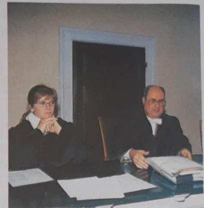
Rechtsprechende Gewalt (Judikative)

„Demokratie“ kommt aus dem Griechischen und bedeutet übersetzt „Herrschaft des ...①...“. Eigentlich müsste das gesamte ...②... sich selbst die Regeln des Zusammenlebens, also die Gesetze, geben und sie vollziehen. Da dies nicht möglich ist, entscheiden die Bürgerinnen und Bürger durch ...③..., welche Abgeordneten sie in den ...④... repräsentieren, also vertreten. Man bezeichnet dies auch als parlamentarische oder repräsentative Demokratie. ...⑤..., also Volksentscheide, sind nach dem Grundgesetz nur dann vorgesehen, wenn das Bundesgebiet neu gegliedert werden soll. Dies ist z. B. der Fall, wenn ...⑥... zusammengelegt werden sollen. 1996 wurde in den Bundesländern Berlin und Brandenburg durch eine ...⑦... gegen die geplante Zusammenlegung dieser beiden Länder entschieden.