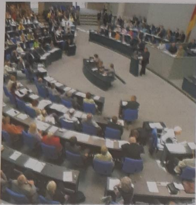
Gesetzgebende Gewalt (Legislative)

b) Schreibe den Lückentext ab und setze dabei die fehlenden 15 Begriffe ein.