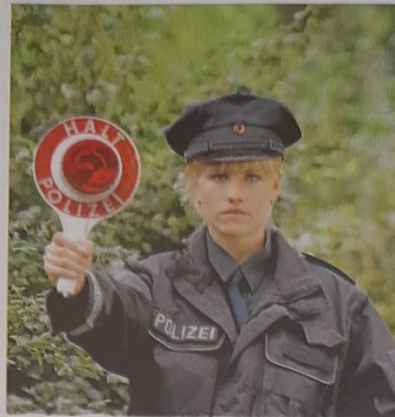
Vollziehende Gewalt (Exekutive)